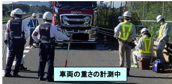
車両の重さの計測中