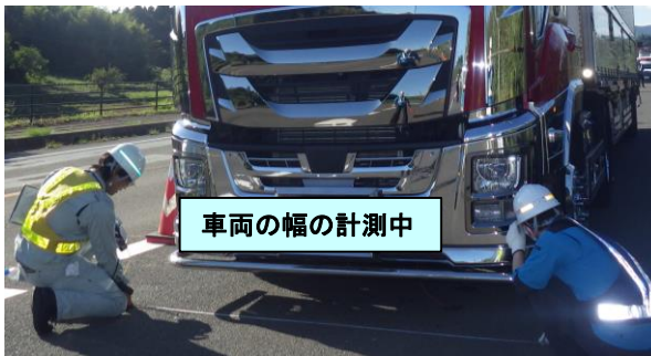
車両の幅の計測中