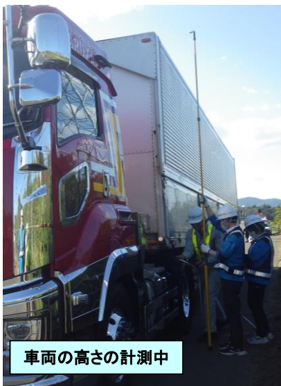
車両の高さの計測中