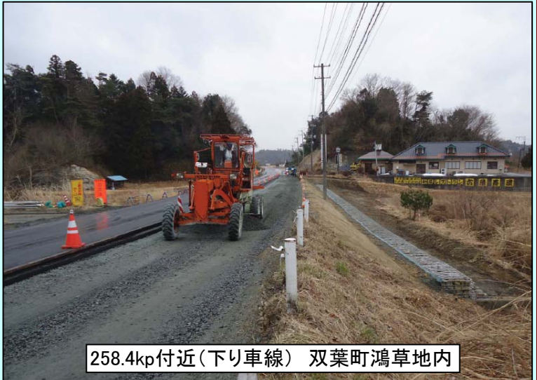
258.4kp付近(下り車線) 双葉町鴻草地区内

なお、福島第一原子力発電所から20km圏内の警戒区域は、許可を得た方以外立ち入ることが出来ません。