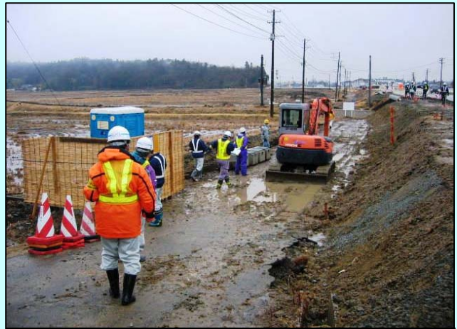
▲工事現場パトロール(原町災害復旧その1工事)