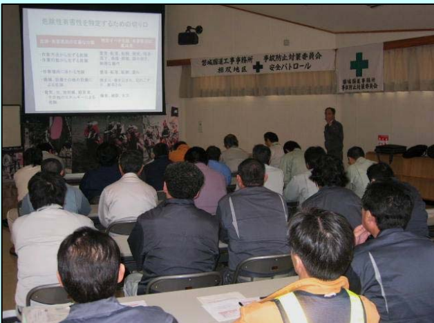
▲労働安全コンサルタントによる講話