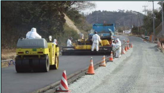
258.4kp付近(上り車線) 双葉町鴻草地区内

また、その他の区間も毎月パトロールを行い、一時立ち入りされた方が安全に通行できるよう維持管理に努めています。