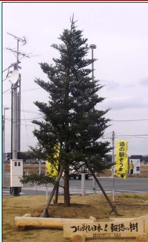
▲モミの木は高さが約8mで、道路情報館北側のスペースに植樹されています。

平成24年3月7日、道の駅「そうま」において、先月末に植樹されたモミの木の受け渡し式が行われました。