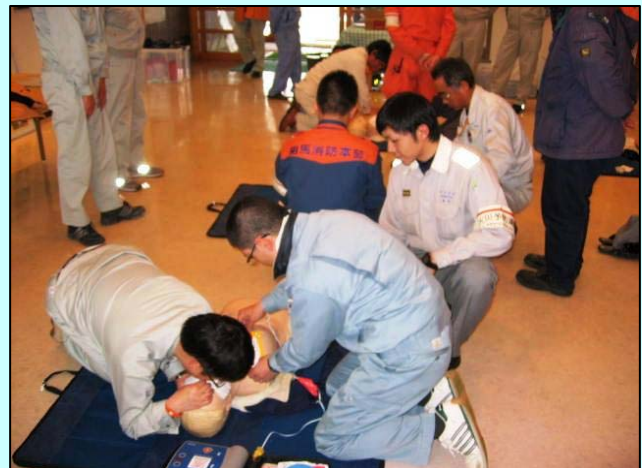
▲相馬消防署による救急救命とAED操作の訓練