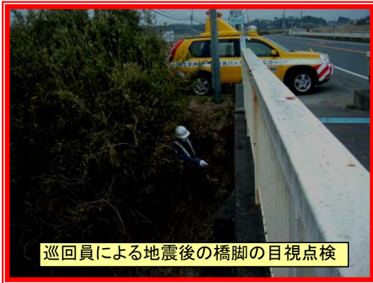
巡回員による地震後の橋脚の目視点検

磐城国道事務所では、管内で震度4以上の地震が発生した場合、昼夜問わず直ちに注意又は警戒体制等をとります。原町維持出張所でも国道6号(広野町～新地町)のパトロールを実施し、道路が通行可能か、そして、橋梁等の構造物に異常がないか点検します。