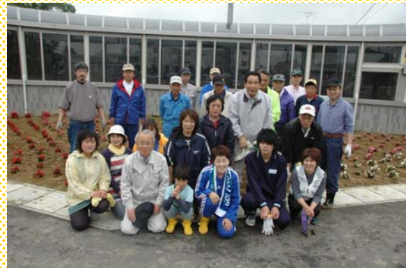
参加された方々です。