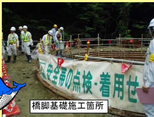
橋脚基礎施工箇所