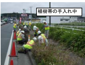
植樹帯の手入れ中