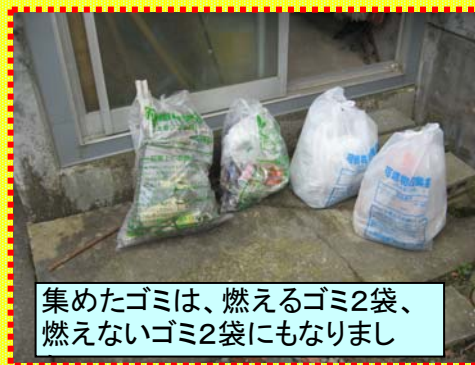
集めたゴミは、燃えるゴミ2袋、燃えないゴミ2袋にもなりまし

国道6号ではたくさんの方々がボランティアで活動してます。これからますます暑くなりますので熱中症対策など作業の際はくれぐれも体調管理、安全には注意していただきますようお願いします。