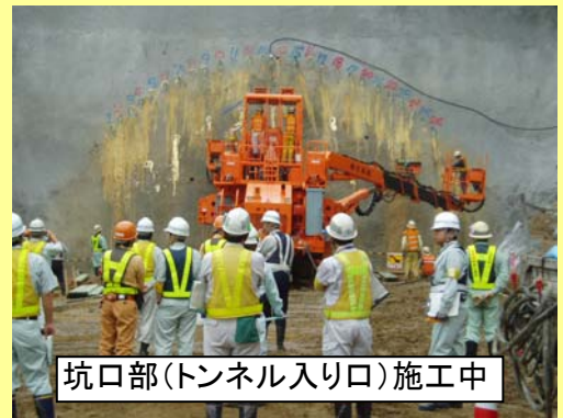
坑口部(トンネル入り口)施工中

参加されているのは、主に各工事現場の責任者の方々です。それぞれ工事現場に戻り指導するため真剣にパトロールしている様子が見受けられました。