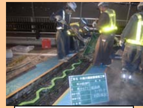
コンクリート流込