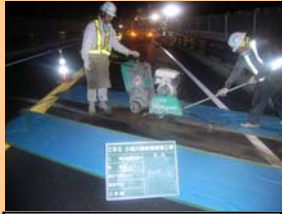
カッターで舗装切取

現在工事中の南相馬市小高区の小高川橋耐震補強工事の進捗状況です。舗装工事が終わり、現在「ジョイント」という部品を橋に取り付けています。「ジョイント」とは隙間の空いた一對の波状の金属部材です。橋梁には鉄骨が含まれており、鉄骨の特性として温度によって伸縮します。その伸縮を下图のようにジョイント部分が動き調整します。現在夜間片側交互通行で工事を進めています。6月上旬完了予定です。ご不便お掛けいたしますがご協力よろしくお願いいたします。