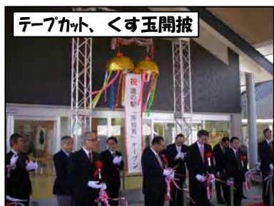
テープカット、くす玉開披