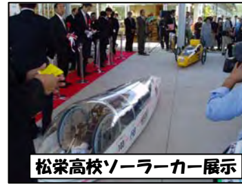
松栄高校ソーラーカー展示