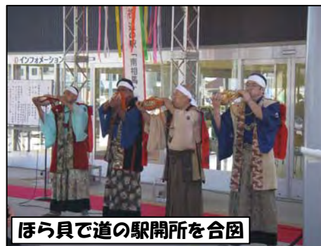
ほら貝で道の駅開所を合図