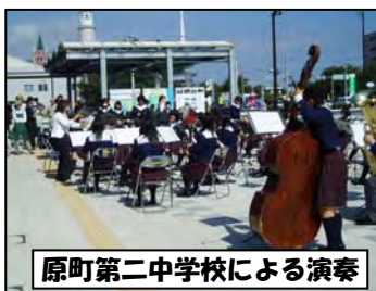
原町第二中学校による演奏