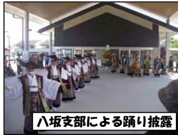
八坂支部による踊り披露