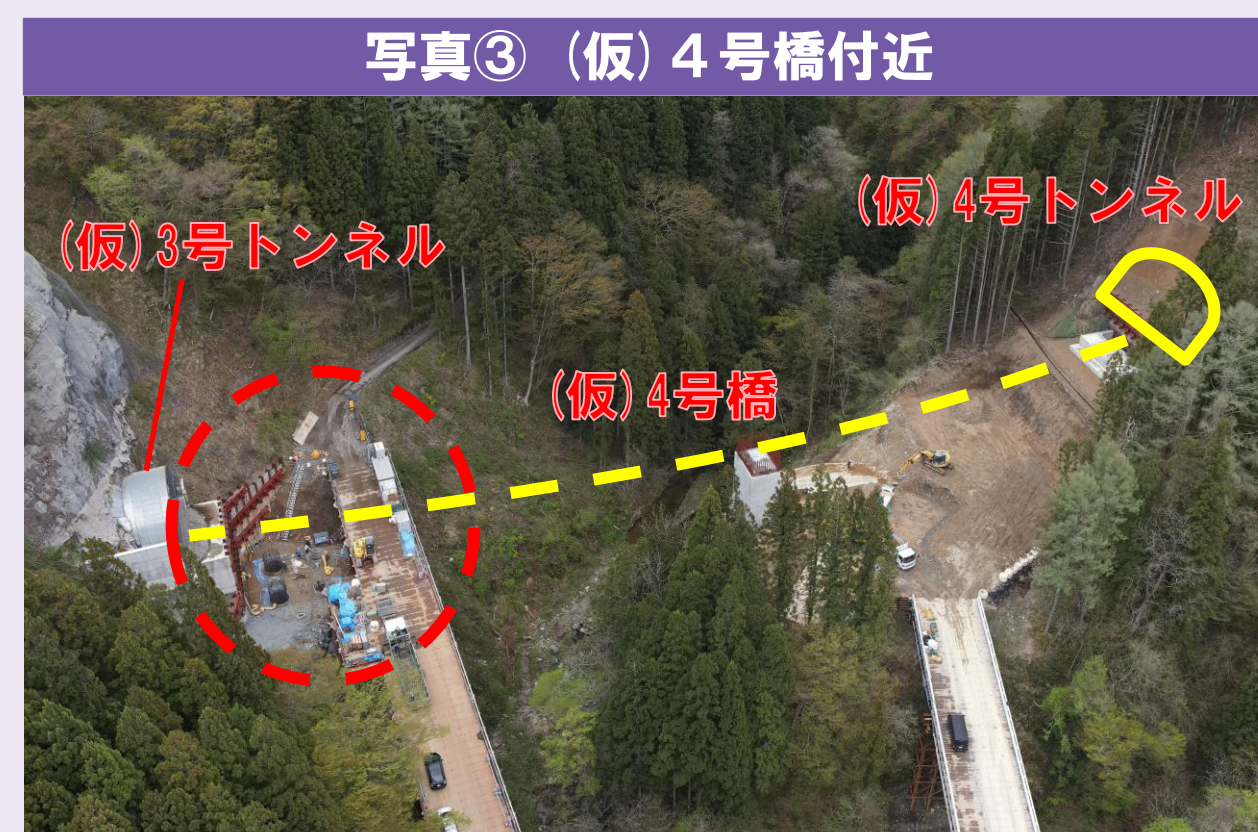
写真③ (仮) 4号橋付近 ●(仮)3号トンネル側の橋台の工事を行っています。基礎部の深礎杭4本のうち2本が完成しています。