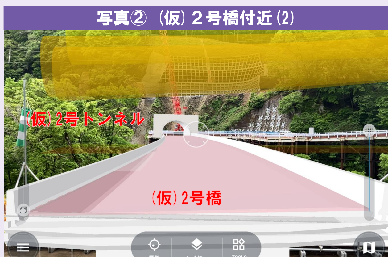
写真② (仮) 2号橋付近 (2) ●AR技術による完成形モデル合成画像。上空にある高圧線の接近禁止範囲も表示できるようにして安全管理にも活用しています。