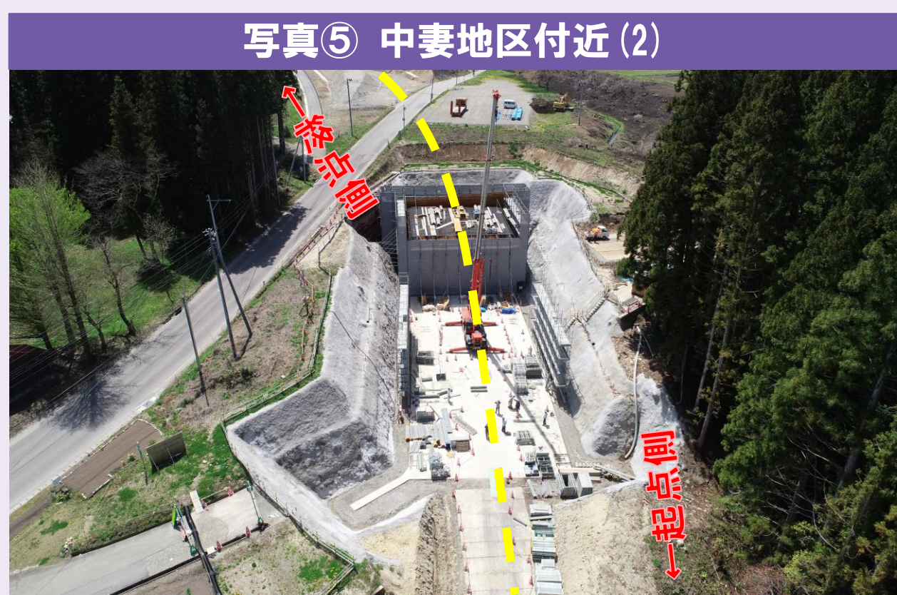
写真⑤ 中妻地区付近 (2) ●本線が通る函渠工の工事を行っています。4ブロックのうち1ブロックが間もなく完成します。