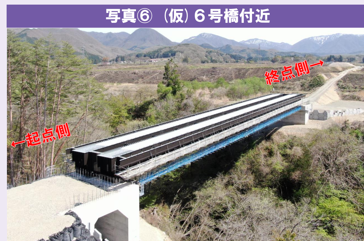
写真⑥ (仮) 6号橋付近 ●上部工本体が完成しました。今後、床版工事や前後の盛土工などを予定しています。