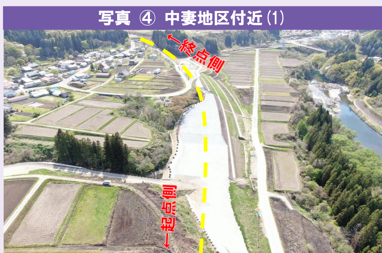
写真④ 中妻地区付近 (1) ●引き続き盛土工や函渠工、排水構造物などの工事を行います。現在は着工準備中です。