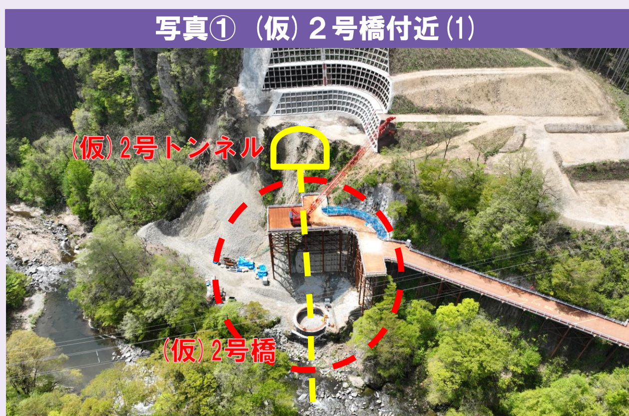
写真① (仮) 2号橋付近 (1) ●(仮) 2号橋の橋脚基礎工（大口径深礎杭）の工事を行っています。