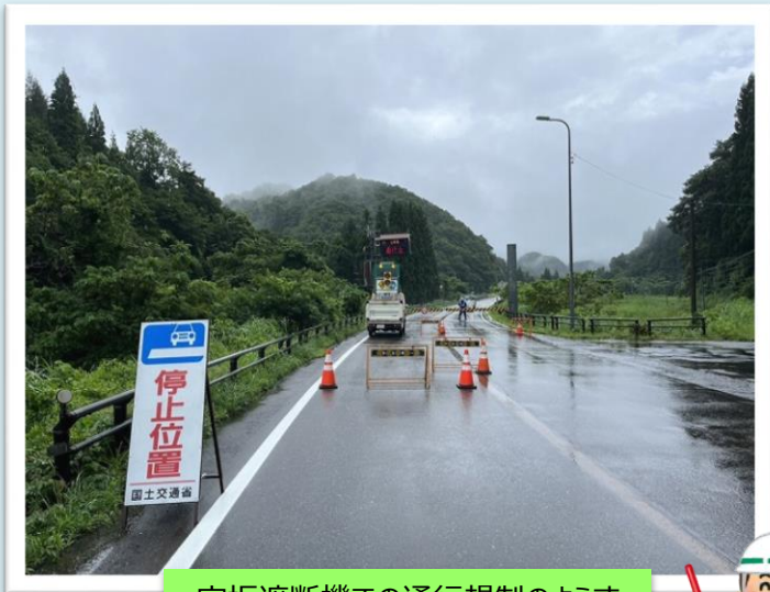
宝坂遮断機での通行規制の様子