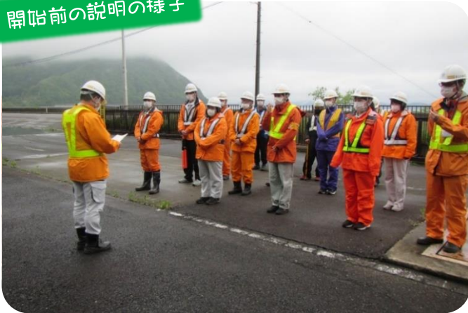
開始前の説明の様子