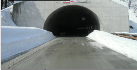
【福島側】 トンネル延長: 5,146m 掘削延長: 5,146.0m(100%) 覆工延長: 4,701.3m(91.4%) 栗子トンネル(福島側)