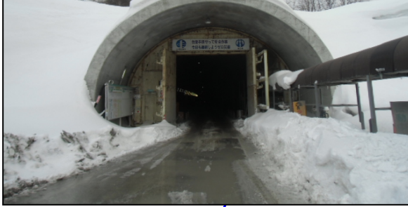
【山形側】 トンネル延長: 3,826m 掘削延長: 3,767.4m(1月末) 覆工延長: 3,008.5m(78.6%) 栗子トンネル(山形側)