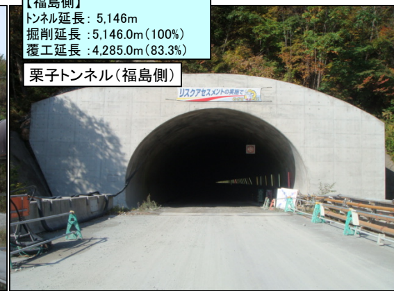
【福島側】 トンネル延長: 5,146m 掘削延長: 5,146.0m(100%) 覆工延長: 4,285.0m(83.3%) 栗子トンネル(福島側)