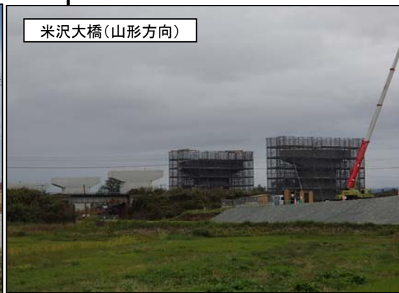
米沢大橋(山形方向)