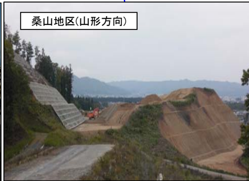
桑山地区(山形方向)