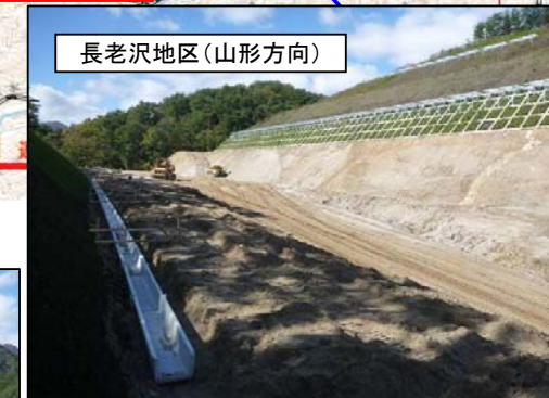
長老沢地区(山形方向)