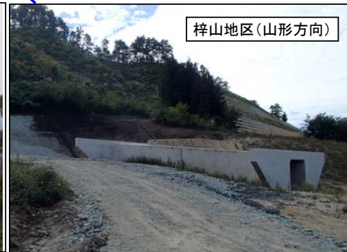
梓山地区(山形方向)