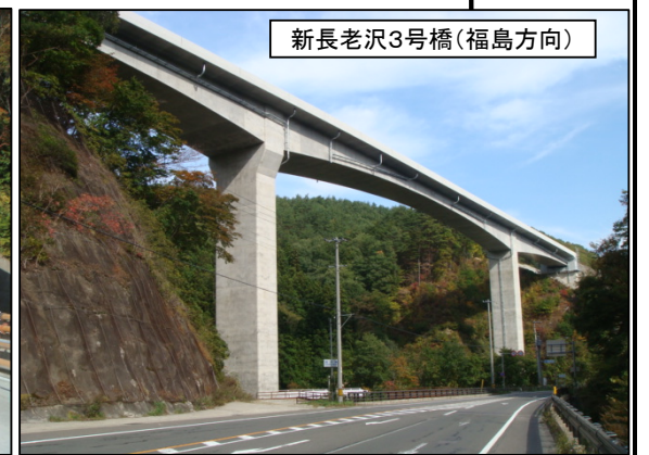
新長老沢3号橋(福島方向)