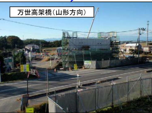
万世高架橋(山形方向)