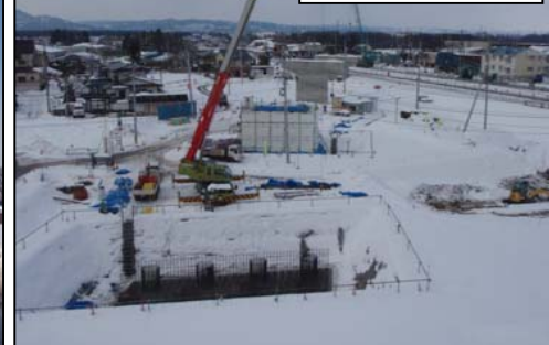
万世地区(山形方向)