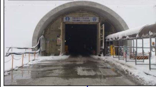
栗子トンネル(山形側)

【福島側】 トンネル延長: 5,146m 掘削延長: 4,277.7m (83.1%) 覆工延長: 2,926.4m (56.9%)