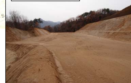
長老沢地区(山形方向)