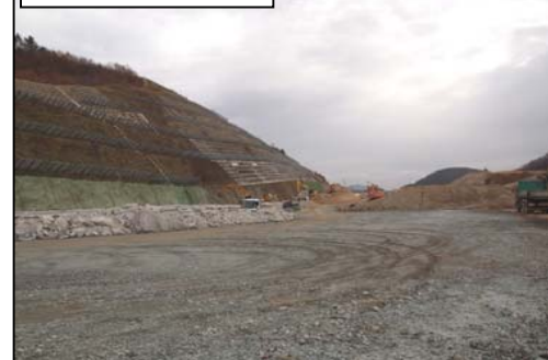
大滝地区(福島方向)