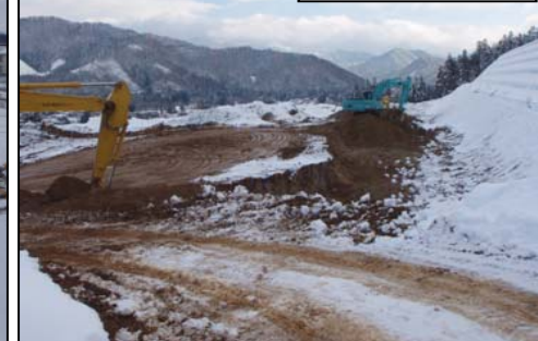
桑山地区(福島方向)