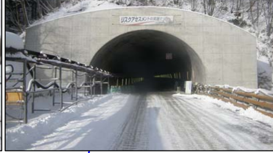
栗子トンネル(福島側)