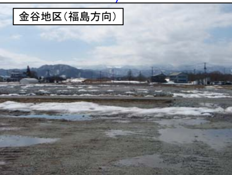
金谷地区(福島方向)