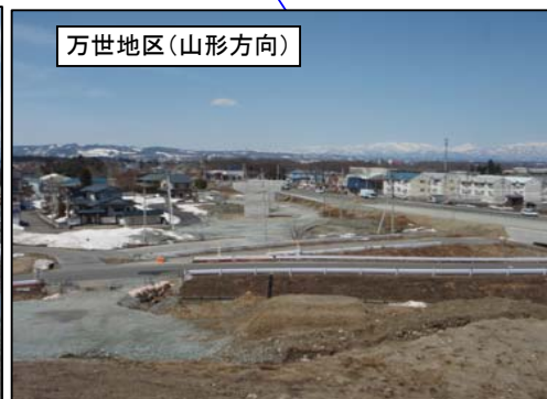
万世地区(山形方向)