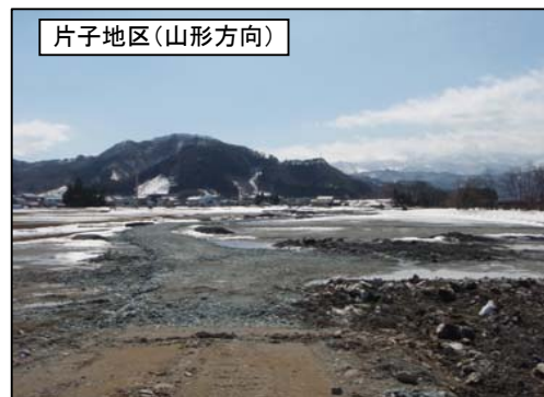
片子地区(山形方向)