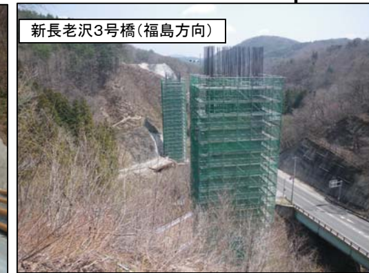
新長老沢3号橋(福島方向)

【福島側】 トンネル延長: 5,146m 掘削延長: 3,256.0m (63.3%) 覆工延長: 1,681.0m (32.7%) 栗子トンネル(福島側)