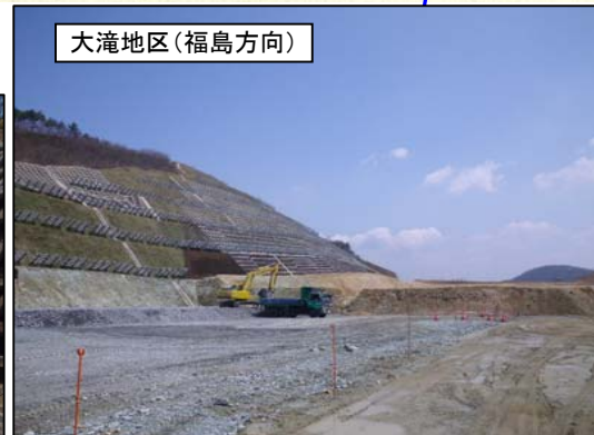
大滝地区(福島方向)