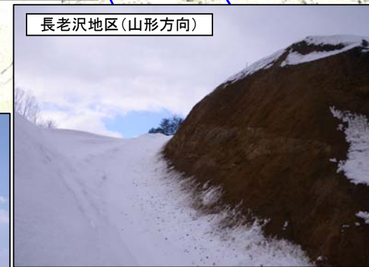
長老沢地区(山形方向)