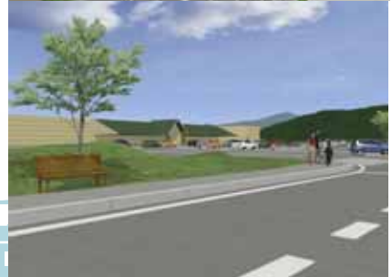
クローバが育つとアースマウンドは 緑に被われます

当初は大型商業施設の緑地と道路緑地が個別に計画されていましたが、用地区分を越えて一体的に整備することで幅 10m × 長さ 400m のボリュームのある緑地になりました。安達太良山の地形をおもわせる緩やかな起伏から「アースマウンド」と呼んでいます。