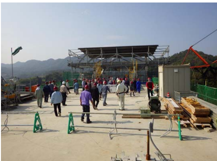
高架橋の見学状況