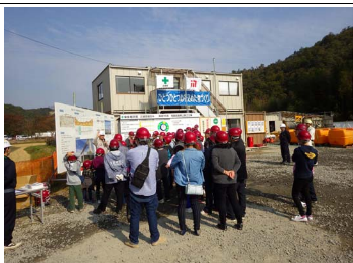
工事進捗の説明状況