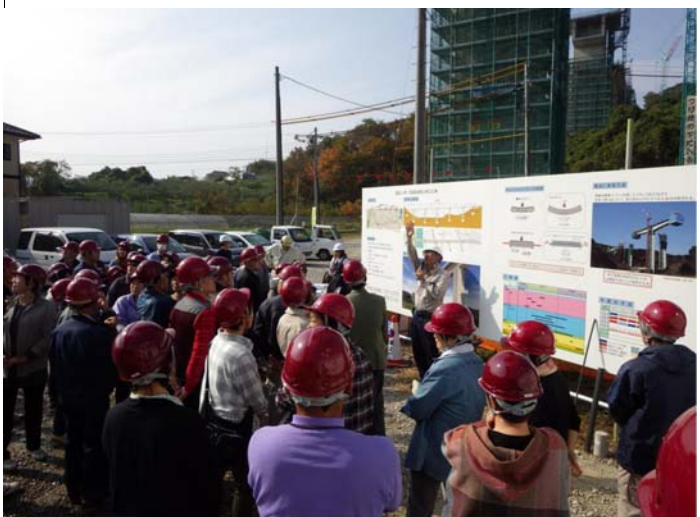
橋梁の施工方法説明状況