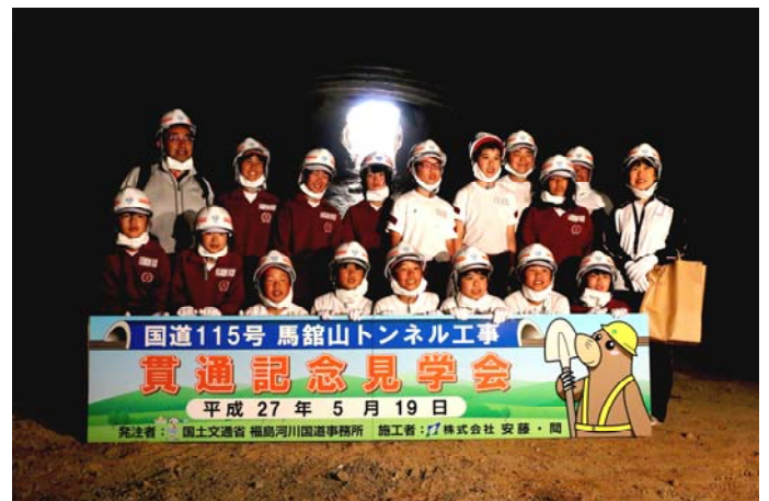
▲ 月館小学校集合写真