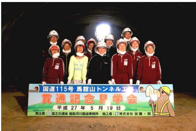
▲ 小国小学校集合写真