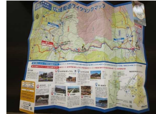
写真：広域周遊サイクリングマップ

令和3年度の東北中央自動車道（相馬～福島間）全線開通により、伊達市では「道の駅伊達の郷りょうぜん」を拠点とした「レンタサイクル事業」と併せ「道・絆プロジェクト事業」を活用した「広域周遊促進サイクリングマップ」を作成し、関係4市と連携した周遊促進に取り組んでいます。