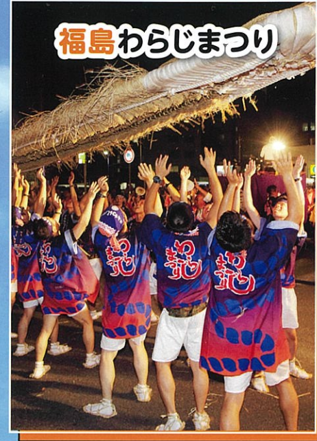
福島わらじまつり