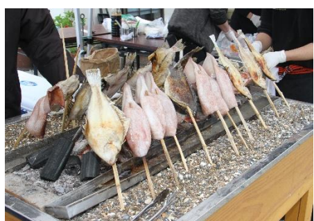
カレイ・イカ・ツボダイを 秘伝のタレでじっくりと焼き上げる