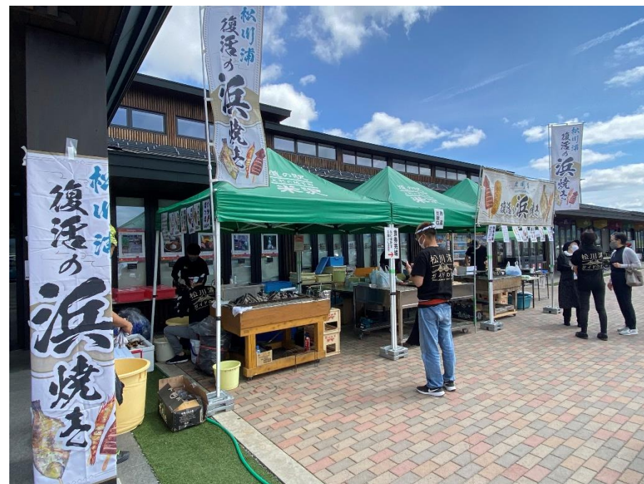
「浜焼き」を地元以外で初めて出張販売 (本年6月 山形県米沢市・道の駅米沢)