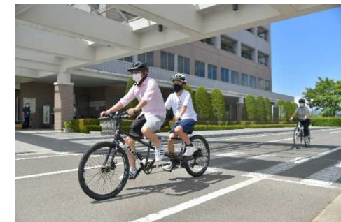
写真：レンタサイクル（タンデム自転車）