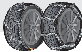
大型車用金属チェーン

残り溝深さが「プラットホーム」に達している状態。冬用タイヤとして使用できません。