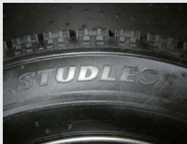
スタッドレス表記の例