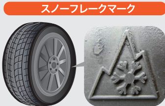
(タイヤの側面に表示されています)