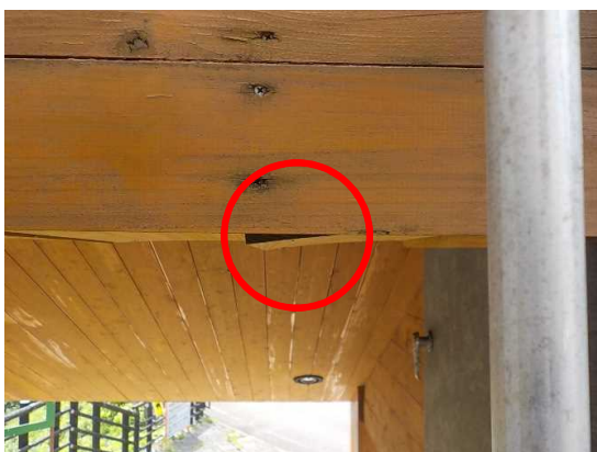
展望台の天井板を止めているねじが緩んでいる