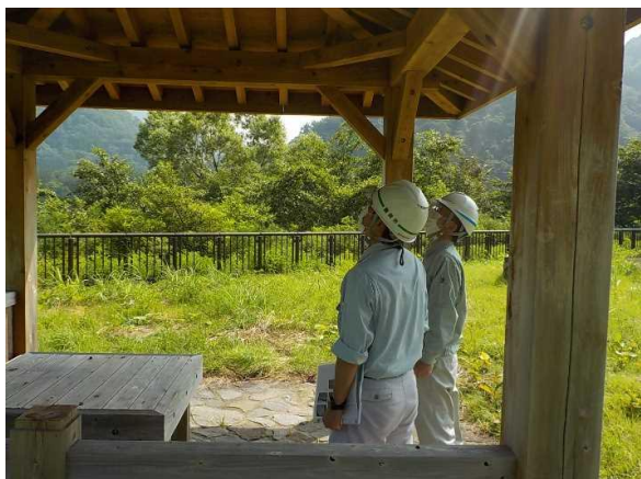
たしろ多目的広場