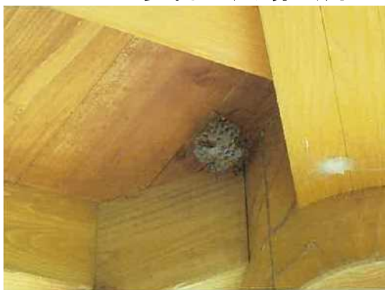
東屋の天井に蜂の巣