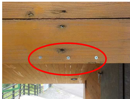
ねじの追加と締め直しを実施