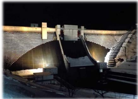
【H29. 12月ライトアップ状況】

12月から2019年1月に行われる地域の主要なイベント等に合わせて 月山ダムのライトアップを実施します。