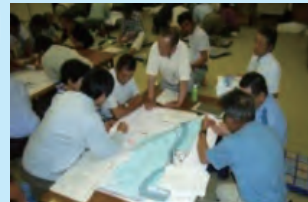
マイ防災マップづくり