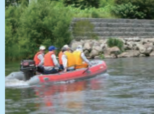
船による河岸の情報収集等