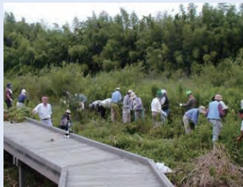
ビオトープの整備