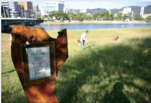
市民団体による看板設置事例 (太田川)

これらの河川法上の許可等について、河川管理者との協議の成立をもって足りることとなります。