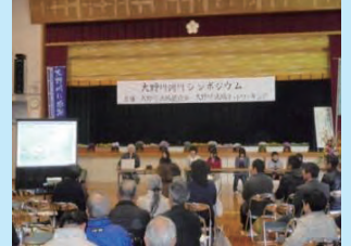
シンポジウムの開催