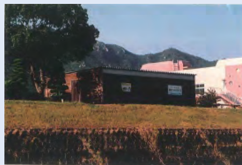
市民団体による活動拠点の整備事例 (佐波川)