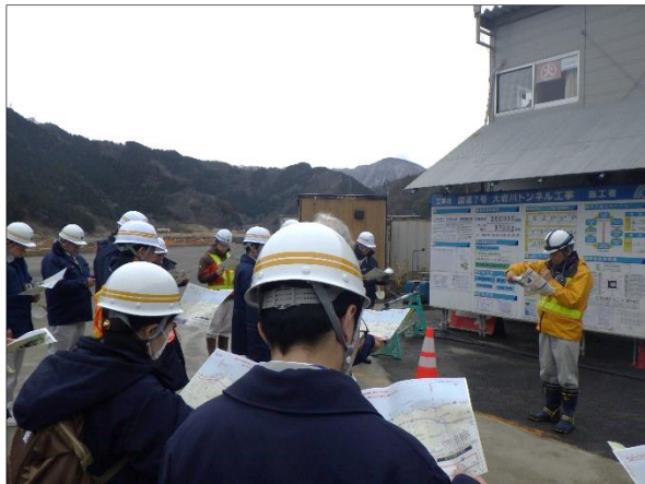
★担当の建設監督官が工事概要を説明

現在、朝日温海道路で最も規模の大きな工事である「大岩川トンネル」。その工事現場に、村山総合支庁ほか23名の皆様が登場見学に来ました！今回は、トンネル内部の防水シートや覆工コンクリートの施工箇所を見ていただきました。