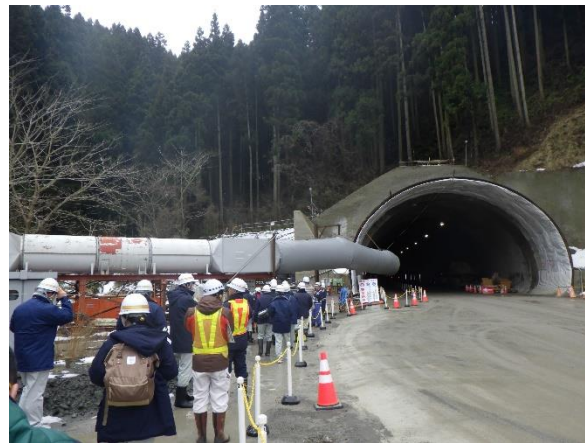
★いよいよトンネルの中に入ります