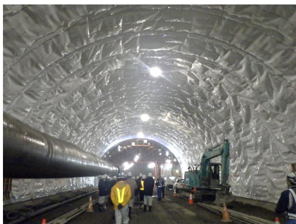
★防水シート工が完了した箇所