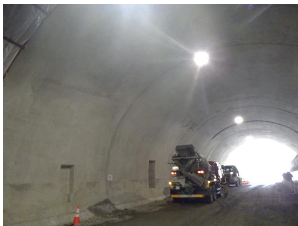
★覆工コンクリートが完了した箇所 だんだんトンネルらしい見た目になってきました！