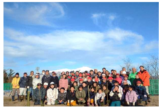
★最後は鳥海山をバックに記念撮影！

日本海沿岸東北自動車道「酒田みなと～遊佐」、「朝日温海道路」、「遊佐象潟道路」の情報をお知らせしていきます。