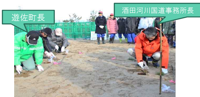
★代表者による記念植樹