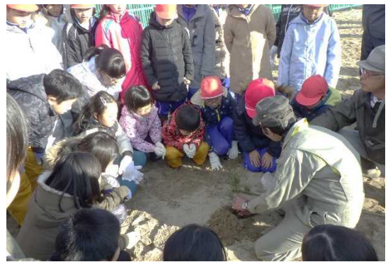
★地元協議会の方に植樹を教わります