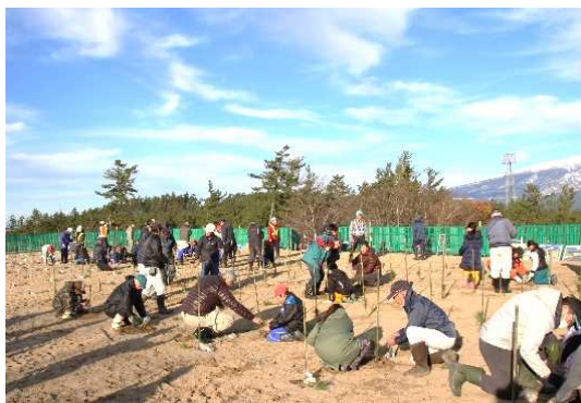
★快晴の下、クロマツ210本を植樹