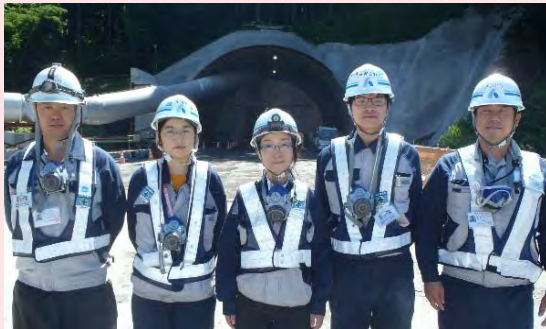
大岩川トンネル工事に従事する 奥村組の技術者のみなさん

現在、朝日温海道路では「大岩川トンネル」の工事をしていますが、この現場では、女性の技術者の方が働いています。今回は、その女性技術者の方に現場での貴重な話を聞かせてもらいました！