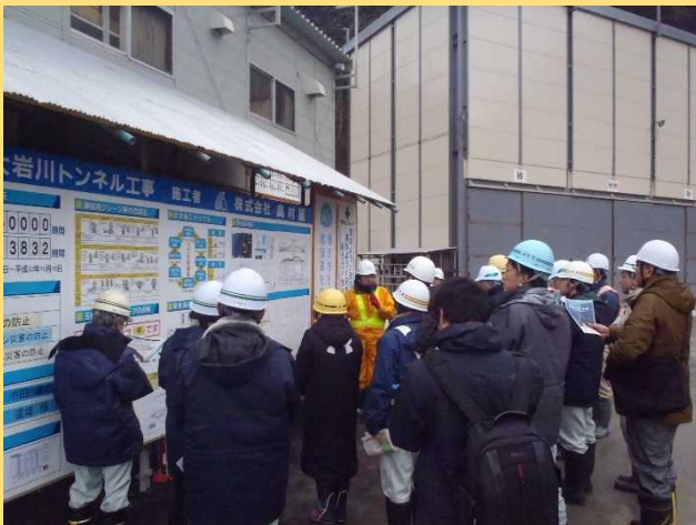
酒田河川国道事務所職員から工事の概要を説明