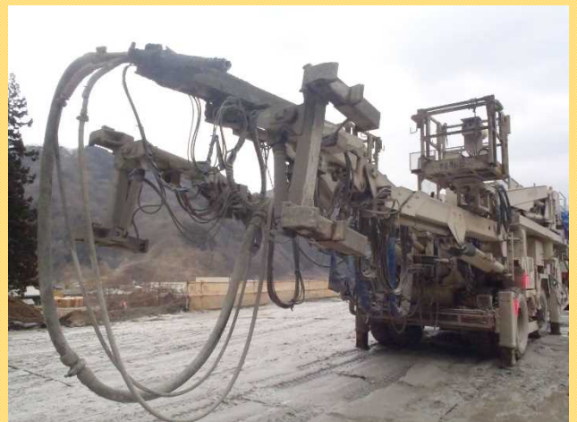
コンクリート吹付け機

日本海沿岸東北自動車道「酒田みなと～遊佐」、「朝日温海道路」、「遊佐象潟道路」の情報をお知らせしていきます。