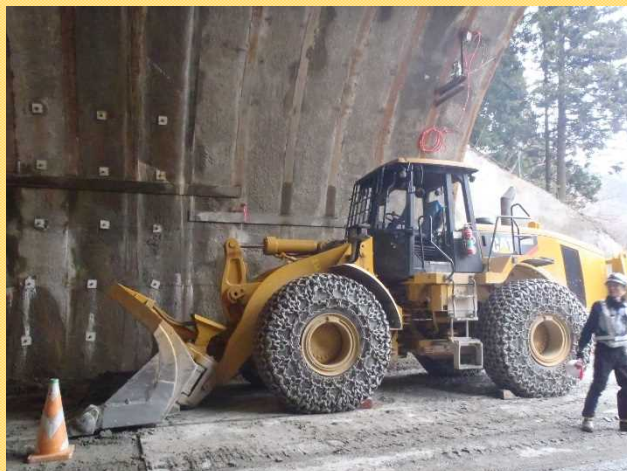
掘削土を運ぶ「ホイールローダー」