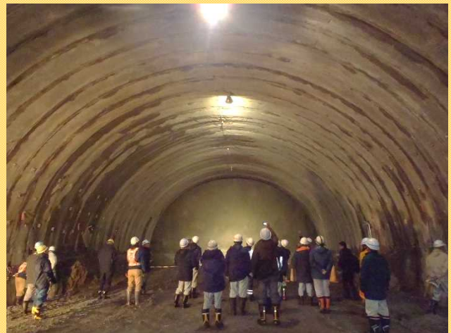
切羽（掘削の先端部）も見学