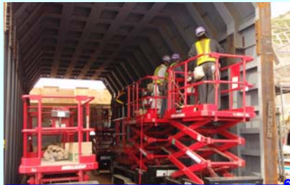
フロテクター組立

なお、「運搬・据付・設置(固定)」作業は、一時通行止め中(夜間)に施工を行いました。