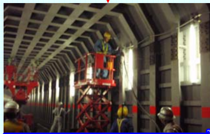
フロテクター設置(固定)

フロテクターとは……? トンネル掘削中をとり、安全に車両が通行できるようにするための壁の役割。