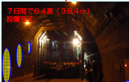
7日間で64基(384m)設置完了。