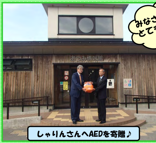
しゃりんさんへAEDを寄贈♪