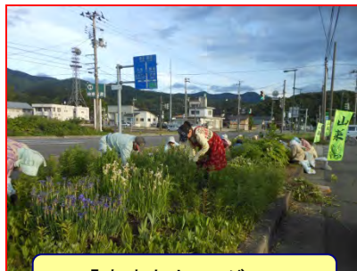
「産直あさひ・グー」

国道112号では、そのほか様々な団体に活動していただいております。道路の保全に貢献されています。ドライバーの皆さん、沿道で活動されているのを見かけましたら、スピード控えめにご通行願います。