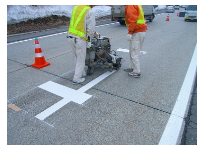
施工状況 (ハンド式)