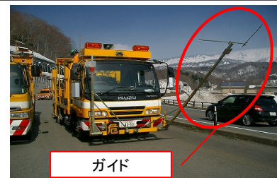
ラインマーカー車