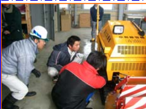
▲操作説明のようす