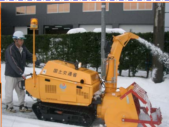
▲試運転で操作方法を確認

12月19日(月)下山添歩道除雪ボランテニア・サポート・プログラム(VSP)の除雪車引渡式を行いました。VSPは、地域ボランテニア、道路管理者(国)、地元自治体の3者協働・連携により、冬期の歩道(通学路)確保を目的として除雪を行って頂いております。 今年度から、新しい除雪車を導入し、より安全・迅速な除雪が可能となりました。下山添VSPメンバーの皆様、今シーズンもよろしくお願ひします。