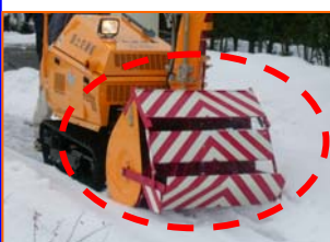
▲巻込み防止機能を装備