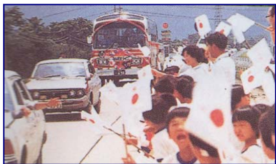
開通パレードに沸く大勢の人々（旧朝日村）

昭和56年の開通以来、地すべり災害や、厳しい冬場の気象条件など、数々の困難に見舞われましたが、こうした試練を乗り越え30年目となりました。これもひとえに地域の皆さま、利用者の皆さまご支援・ご協力の賜物と感謝いたしております。出張所職員一同、これを一つの区切りとして、より快適にご利用いただけるように管理にあたって参りますので、今後ともよろしくお願いいたします。