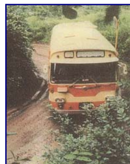
旧道はやっとバスが通れる広さ