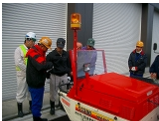
安全講習会実施状況