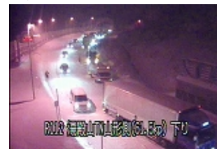
12月15日 登坂不能車停車による渋滞発生

月山道路は日本有数の豪雪地域を通過していることから、路面が圧雪になりやすいため、路面情報を確認の上、早めのチェーン装着をお願いします。