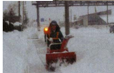
VSP作業状況(写真は平成20年度)