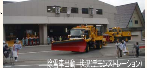
除雪車出動 状況(デモンストレーション)