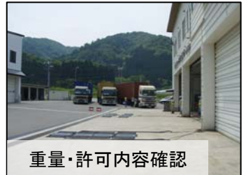
※特車取り締まり状況(5/22)