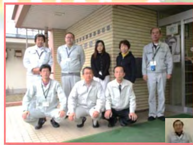
▲今年も酒田出張所全員が まとまって頑張ります！

これからも本紙で地域話題などを中心にタイムリーな情報を皆様へお届けしたいと考えています。この新しい年が良き年となりますよう祈念するとともに、今年も酒田出張所、並びに「酒田出張所ニュース」をよろしく願いたします。