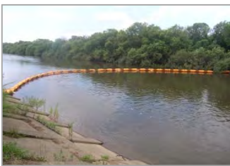
オイルフェンス設置状況

暖房器具を活用するこの時期、一般家庭のホームタンクや事業所のタンクから灯油などの油類が漏れ出し、河川などに流出する事故が多発します。油類などが河川へ流出すると上水道の取水停止やそれに伴う断水、魚類や植物等への悪影響など、様々な被害を及ぼします。また、水質事故を起こすと、その処理のために設置するオイルフェンスや油吸着マットなどの設置経費は原因者の負担となります。灯油を小分けにする際のバルブの閉め忘れなど、十分に注意してください。