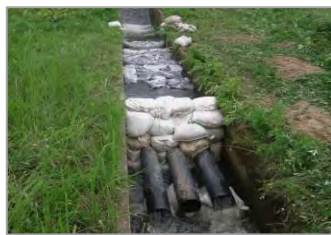
水路での油回収状況

油流出事故が発生、もしくは発見した場合は、直ちにお近くの国や県の機関、市町村役場、消防署、警察署へご連絡ください！！