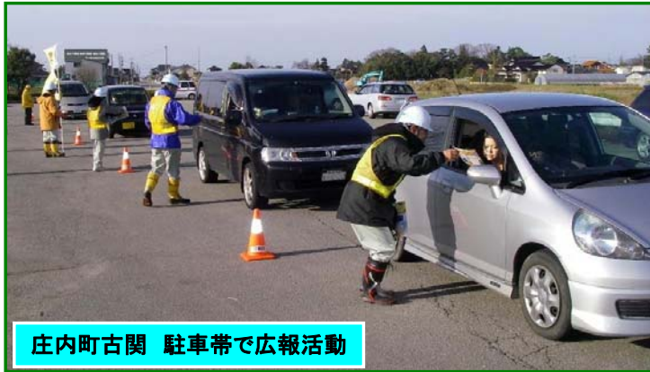
庄内町古関 駐車帯で広報活動

また、出動式終了後、国道47号(庄内町古関駐車帯)で冬タイヤの早期装着を呼びかける運動を実施しました。