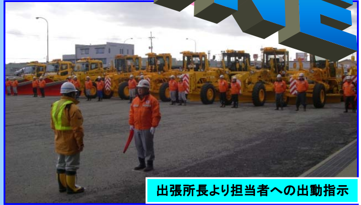
出張所長より担当者への出動指示

国道7号・47号の除雪作業は、酒田と余目除雪ステーションの2箇所を除雪車17台を配備し、安全・安心な冬道確保のため、24時間体制で行います。