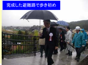
完成した避難路で歩き初め