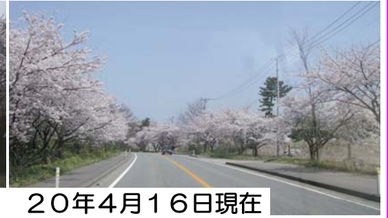
遊佐町比子字白木地内 20年4月16日現在