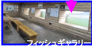
フィッシュギャラリー