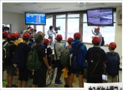
さみだれ大堰フィッシュギャラリー

当日は、小雨が降るあいにくのお天気でしたが、子供たちは元気いっぱい、見て・学んで・体験しました。