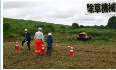
除草機械操作体験