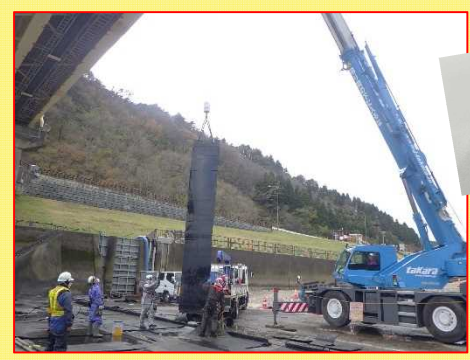
取り出した袋体の一部はフィッシュギャラリで展示しています。