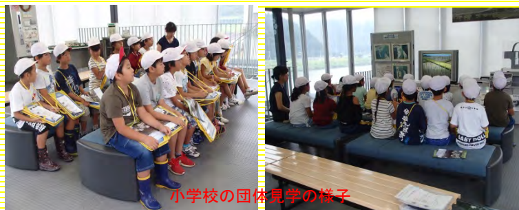
小学校の団体見学の様子