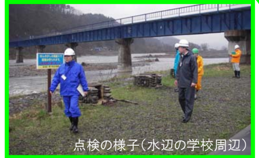
点検の様子(水辺の学校周辺)