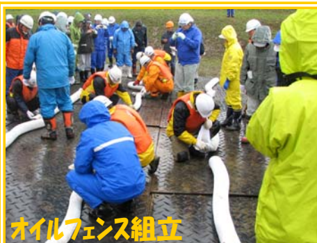
オイルフェンス組立