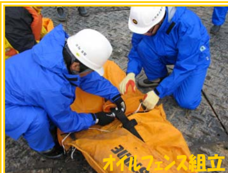
オイルフェンス組立