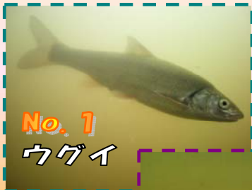
No. 1 ウグイ

堰起立期間中の現在、地下のフィッシュギャラリーでは様々な種類の魚を見ることができます。ぜひ見に来てください!