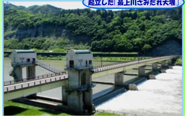
起立した「最上川さみだれ大堰」

今年も春の融雪出水が終わり、渇水期の農業用水の安定供給をはかるため「最上川さみだれ大堰」を起立し稼働開始しました。今年では平成7年の稼働開始以来、最も早かった去年よりも更に6日早い起立となりました。「最上川さみだれ大堰」の起立期間は、堰より下流部の水田で稲刈りを迎える9月中旬頃までとなります。