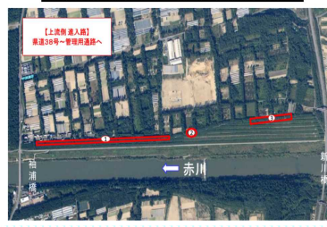
公募型伐採区画図(酒田市浜中地区)