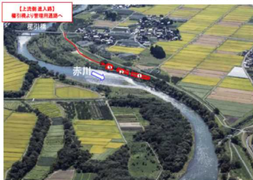
公募型伐採区画図(鶴岡市松根地区)