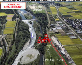
公募型伐採区画図(鶴岡市勝福寺地区)