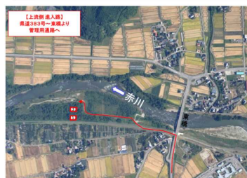
公募型伐採区画図(鶴岡市西片屋地区)