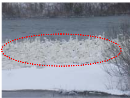
おばこ大橋付近に約300羽の白鳥が見られました。

みなさんも赤川で『あれ?おかしいな?』と気づいたことがあれば是非、赤川出張所までご一報願います。