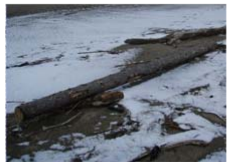
赤川河口域に丸太の漂着物を発見しました。