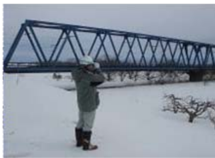
双眼鏡を使って、河川の異常がないかチェックします。