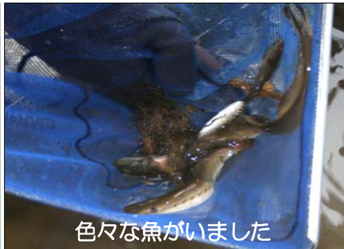
色々な魚がいました