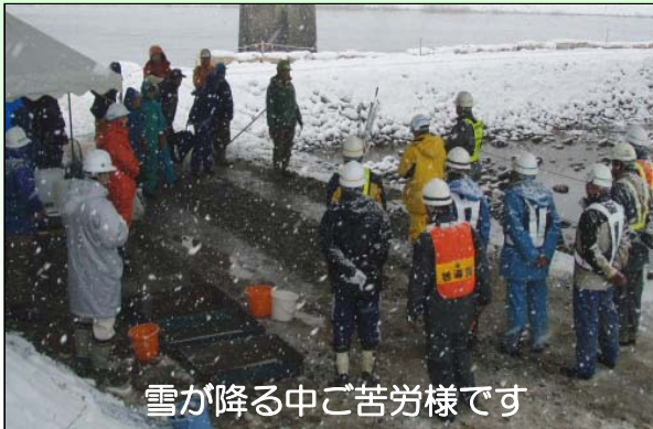
雪が降る中ご苦労様です

12月15日(火)に、鶴岡市東岩本地内の東橋下流で、魚の引っ越し作業が行われました。赤川自然再生事業の一環として、東岩本床止の魚道の一部を切り下げ、幅を10m拡幅し魚が遡上しやすくする工事を施工するために仮締め切りをしました。その中に取り残された魚を安全な場所に移動させるために、地元住民の方、赤川漁業協同組合、赤川鮭漁業生産組合の方々から協力していただきました。サケ、ヤマメ、カジカ等7種類、約50匹の魚を捕獲し上下流部に放流しました。雪が降り寒い中での作業でしたが、皆さんのおかげで魚達は広い川へ戻れてうれしそうでした。大変ご苦労様でした。